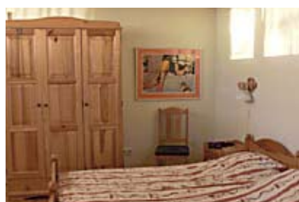
Elch, 2-Zimmer-Wohnung, Schlafraum