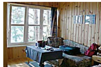
Möve, Einzelzimmer, Wohn-/Schlafzimmer