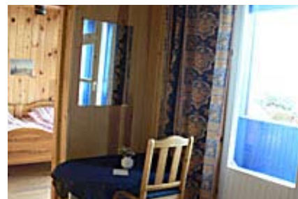
Birke, Blick in das Schlafzimmer