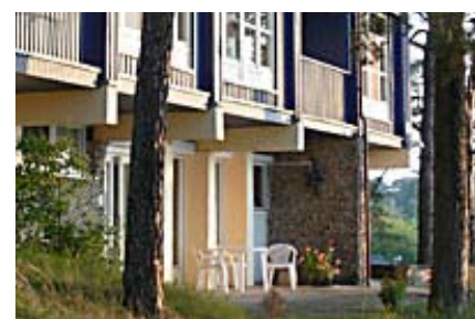
Elch, 2-Zimmer-Wohnung, Terrasse